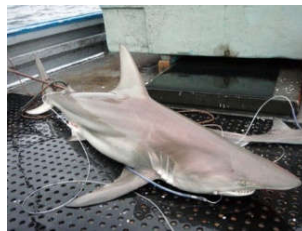
Cá mập lai tìm thấy ở vùng biển của Australia

Jess Morgan, một nhà nghiên cứu của Đại học Queensland tại Australia, nói rằng ông và các đồng nghiệp phát hiện những con cá mập lai trong một chuyến nghiên cứu ở vùng biển phía đông của Australia. Chúng là hậu duệ của hai loài cá mập vây đen là Carcharhinus limbatus (phân bố khắp toàn cầu) và Carcharhinus tilstoni (chỉ sống tại vùng biển ấm của Australia), AFP đưa tin.